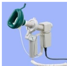
鼻腔通気度センサ